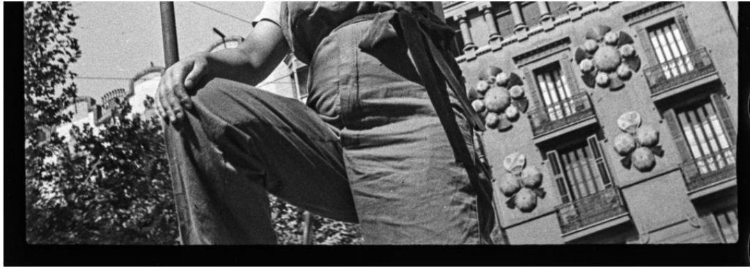
Miliciana a una barricada del carrer Hospital, juliol de 1936.