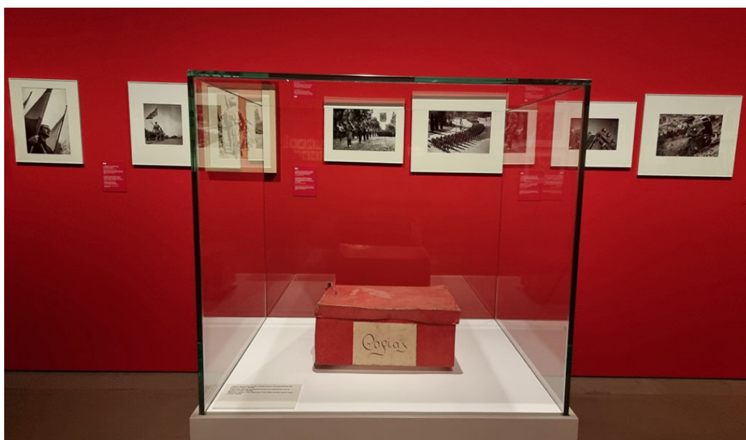
La capsa vermella d'Antoni Campaña al MNAC.

de les seves imatges es publiquen en diaris del règim i l'any 1944 decideix recuperar el seu arxiu, guardar-lo en caixes i amagar-lo per sempre més. És el silenci absolut que es produeix sovint entre aquells que han viscut o patit traumes dels quals no en volen sentir a parlar i que guarden, ocult, al fons de la seva memòria.