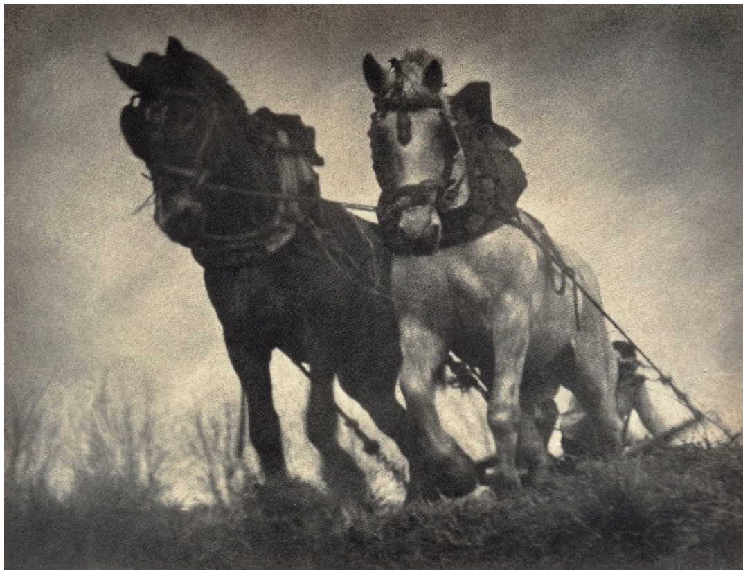
Tracció de sang, 1933. Bromoli © A. Campañà

gelatina hidratada – que contenia la plata – es fa reparèixer amb l'ajut d'una brotxa i pigments monocroms a l'oli. El resultat dona una nova imatge amb unes textures de caràcter pictòric amb matisos de color molt subtils.