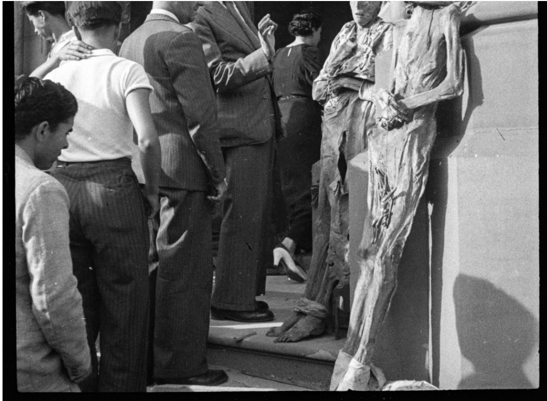
Mòmies del convent de les Saleses, al passeig de Sant Joan de Barcelona, juliol de 1936.